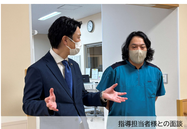
指導担当者様との面談