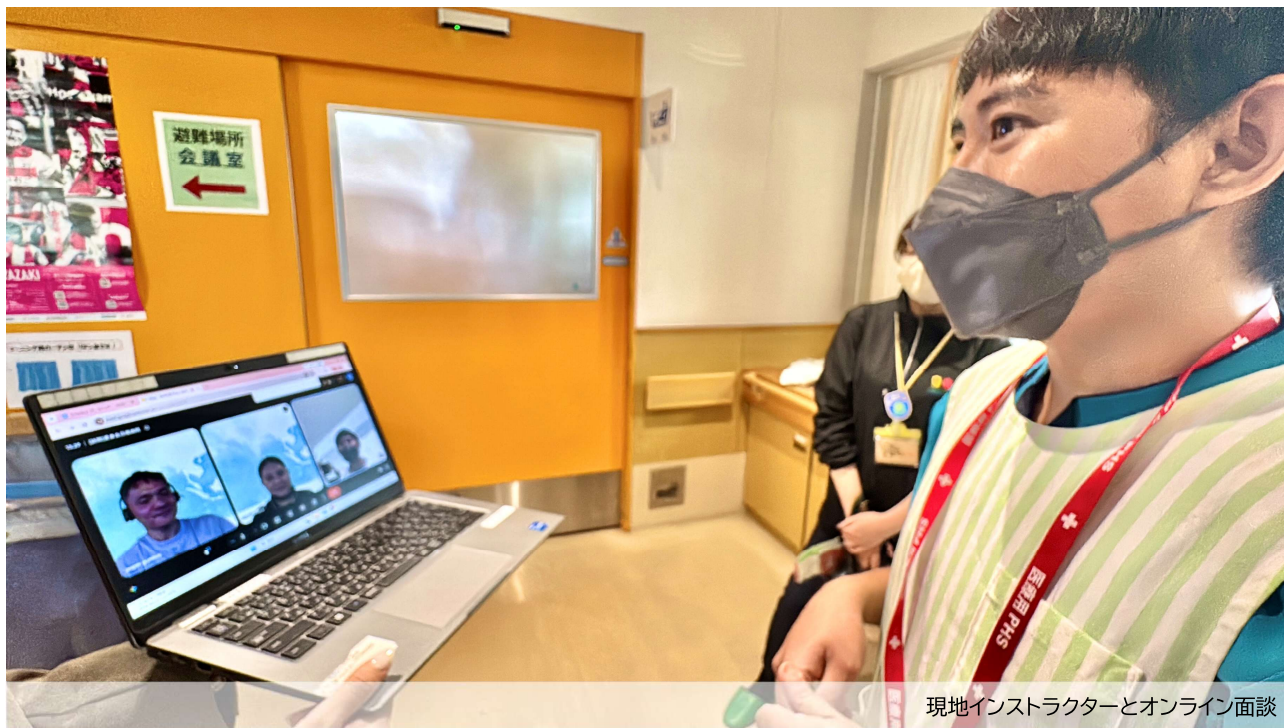
現地インストラクターとオンライン面談

当日はフィリピン現地で3名の授業を担当していたインストラクターとオンラインでつなぎ、業務や日南市での生活について対話する時間を設けました。このように、入国前のアカデミー生活の様子を知るインストラクターが、日本で活躍中のOUR人材と継続して関係を維持し、職場や地域定着に向けたサポートを実施できるのは、人材の募集から教育、紹介、さらに入国後の定着支援に至るまでの全工程を、外部へ委託することなく自社で一貫して実施する独自スキーム「OUR ストレートスルー」の大きな強みです。