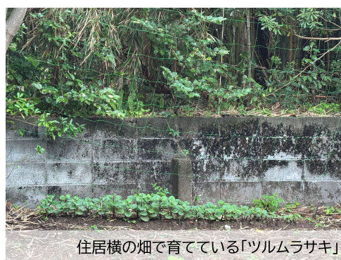
住居横の畑で育てている「ツルムラサキ」

畑では3名の母国であるフィリピンで日常的に食べられている国民的野菜の一つである「ツルムラサキ」の種を日本で購入し、育てる様子が見られました。入国後も母国の味を楽しみながら、食費を抑えることができるため、経済的な安心感につながっています。OURでは、こうしたひとつひとつのサポートが定着率向上につながる重要な支援のひとつと捉えています。