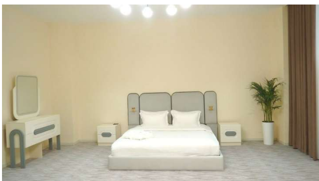
【宿泊分野】実習用客室