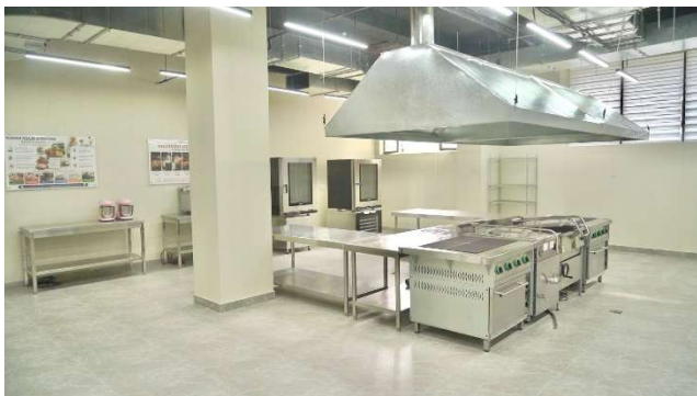
【外食分野】実習用厨房設備