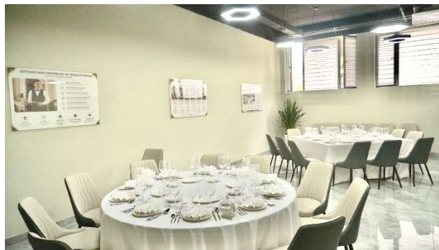
【外食分野】実習用ホール設備