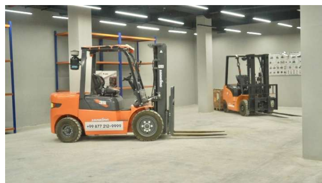
【物流倉庫分野】実習用フォークリフト

単なる言語の学習に留まらず、これら最新の環境で「日本の現場のリアル」を徹底的にシミュレーションすることで、外国人材が来日直後から「安全に、自信を持って」活躍できる確かな即戦力へと育成します。企業にとっても、地域社会にとっても、安心して迎え入れられる『サステナブルな共生社会のパートナー』を、私たちは本気で育ててまいります。