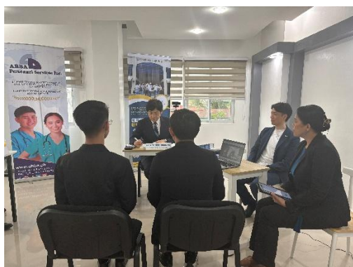
採用面接を受ける学生

また、学生のご家族を対象とした説明会も開催され、日南市の特色、病院の概要や雰囲気、雇用条件、住居環境などについて詳細な説明が行われました。受入れ施設から直接説明を受けることで、学生本人はもちろん、ご家族も企業への理解と安心感を深める機会となりました。その結果、複数名の内定者が誕生しました。