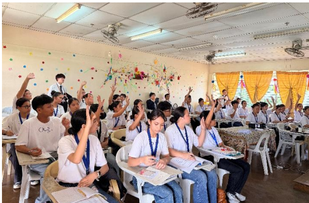
教育現場視察（授業見学）

関連リリース： 宮崎県日南市と特定技能外国人材の雇用促進に関する連携協定を締結 自社海外教育拠点に「日南クラス」を開設