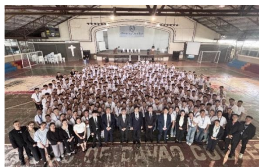
OUR BLOOMING ACADEMY ダバオ 体育館にて集合写真