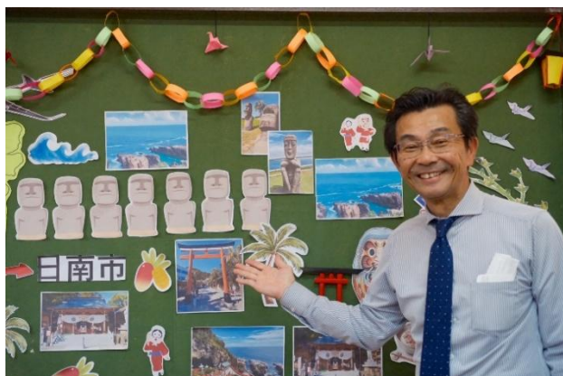
アカデミー内設置の日南市ボード（日南市高橋市長）