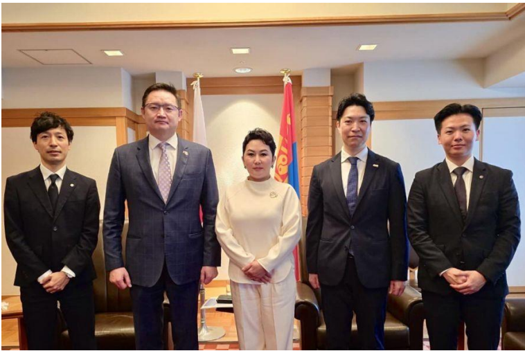
2025 年 3 月、日本へ公式訪問されていたバトムフ・バトツェツェグ外務大臣と会談

なかでも、「人」への投資となる人材育成を軸とした継続的な協力が重要なテーマとして掲げられています。