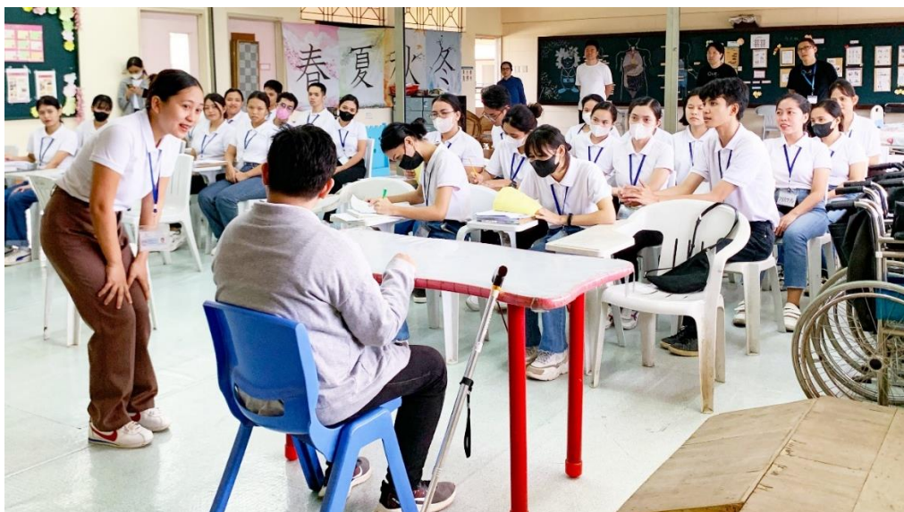
弊社フィリピンアカデミー・ダバオセンターの介護分野の授業の様子