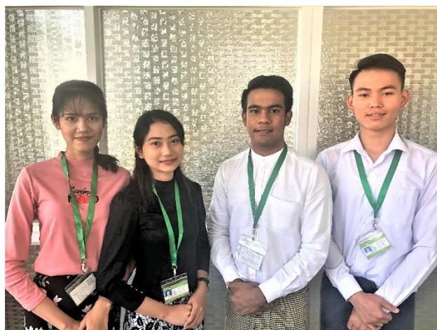
特定技能試験に合格した PW Myanmar の学生（一部）

ONODERA GROUP 傘下である株式会社 ONODERA USER RUN（代表：小野寺 裕司 所在地：東京都千代田区大手町 1 丁目 1 番 3 号）は、運営する教育機関“PW Myanmar”の学生 353 名が、本年 2 月にミャンマー国内にて開催された特定技能試験（介護）に合格したことをお知らせいたします。介護分野の特定技能試験が同国で開催されるのは初となります。PW Myanmar の学生は 376 名受験し、合格率 93.8%を記録いたしました。