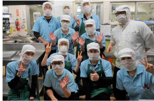
(株)LEOC 事業所で活躍する外国人財皆さんと一緒に