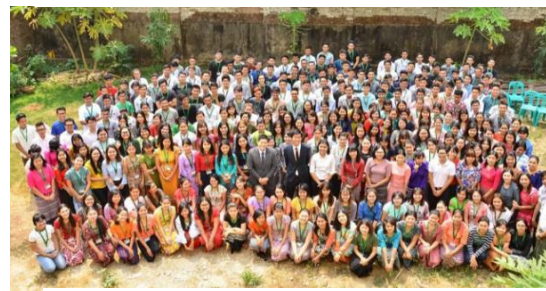
資格取得を目指すミャンマーの学生たち